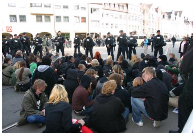
Sitzblockade gegen Nazis am 24.2.2007

Drittens stehen die Vorgaben der letztjährigen Kampagne des Bündnisses für Menschenwürde und der Stadt gegen den Naziaufmarsch im Februar 2007. Da wir die Aktionen und Veranstaltungen am Wochenende des 24. und 25. Februar 2007 politisch als einen echten Fortschritt betrachten, hinter den man heuer nicht zurückfallen sollte, wollen wir kurz rekapitulieren: