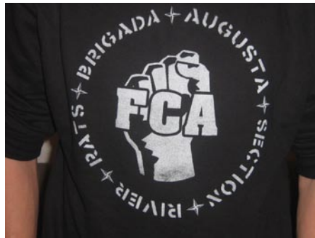
Ein Fanpulli der Augsburger Riverrats

Die antifaschistische Einstellung der anderen im FCA aktiven Menschen kommt ihnen dabei nur entgegen. So lautet eine